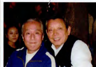
夜桜を愛でながら