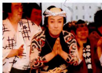
平成中村座・終演後