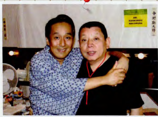
平成中村座ニューヨーク公演・楽屋にて