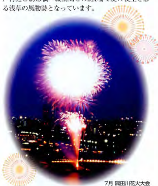
7月 隅田川花火大会

享保年間に始まり、両国の川開きとして250年の伝統を保ってきた花火大会ですが、交通その他の事情により昭和36年を最後に中断しました。それが昭和53年に隅田川花火大会として復活。現在の会場は今戸付近と駒形橋-厩橋間との2会場で夏の夜空を彩る浅草の風物詩となっています。