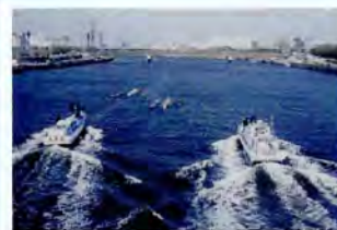
4月 早慶レガッタ