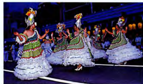
8月 浅草サンバカーニバル

本場のブラジル・リオから、その年の優勝チームを招待して熱狂の夜を過ごすのが、真夏の夜の夢、浅草サンバカーニバルです。お祭り好きで浅草を愛しリオ通であった故・伴淳三郎さんと前台東区長内山栄一氏が意気投合して企画したものです。浅草商店連合会の有志を中心に昭和56年8月29日に第1回浅草サンバカーニバルを成功させました。以後、毎年8月の最終土曜日に開催され、浅草の新しい息吹を示す祭典として定着しています。