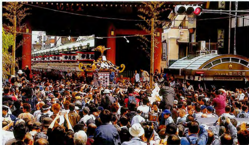
5月 三社祭

浅草神社は、浅草寺観音像を浅草付近（宮戸川）から網得した漁師、檜前浜成（ひのくまはまなり）、竹成（たけなり）と、土地の識者、土師中知（はじのなかとも）の三人を祀るところから、古くは三社権現と称されていました。三社祭の名はここからきています。三社祭は神輿渡御が有名で、浅草神社の氏子町会四十四ヶ町の神輿勢揃いが土曜日の午後1時に浅草寺境内で行われ、浅草が祭り一色に染まります。