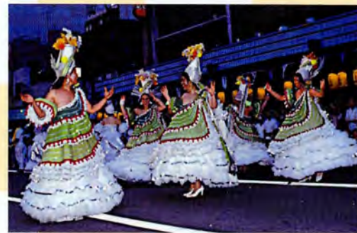
8月 浅草サンバカーニバル