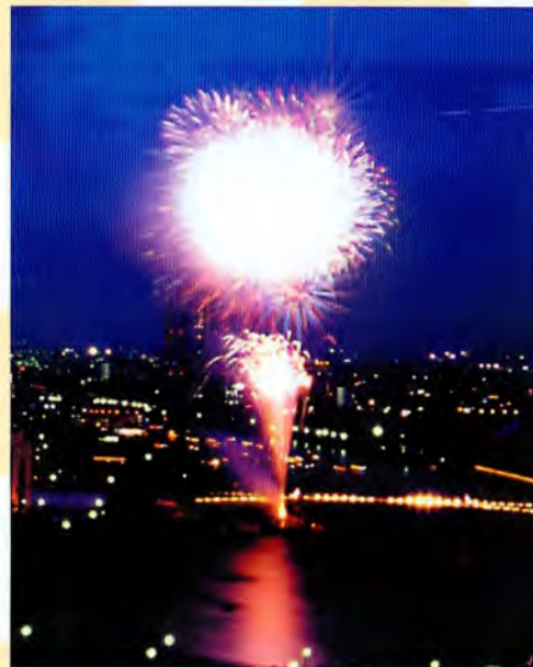
7月 隅田川花火大会

享保年間に始まり、両国の川開きとして250年の伝統を保ってきた花火大会ですが、交通その他の事情により昭和36年を最後に中断しました。それが昭和53年に隅田川花火大会として復活。現在の会場は今戸付近と駒形橋～鷹橋間との2会場で夏の夜空を彩る浅草の風物詩となっています。