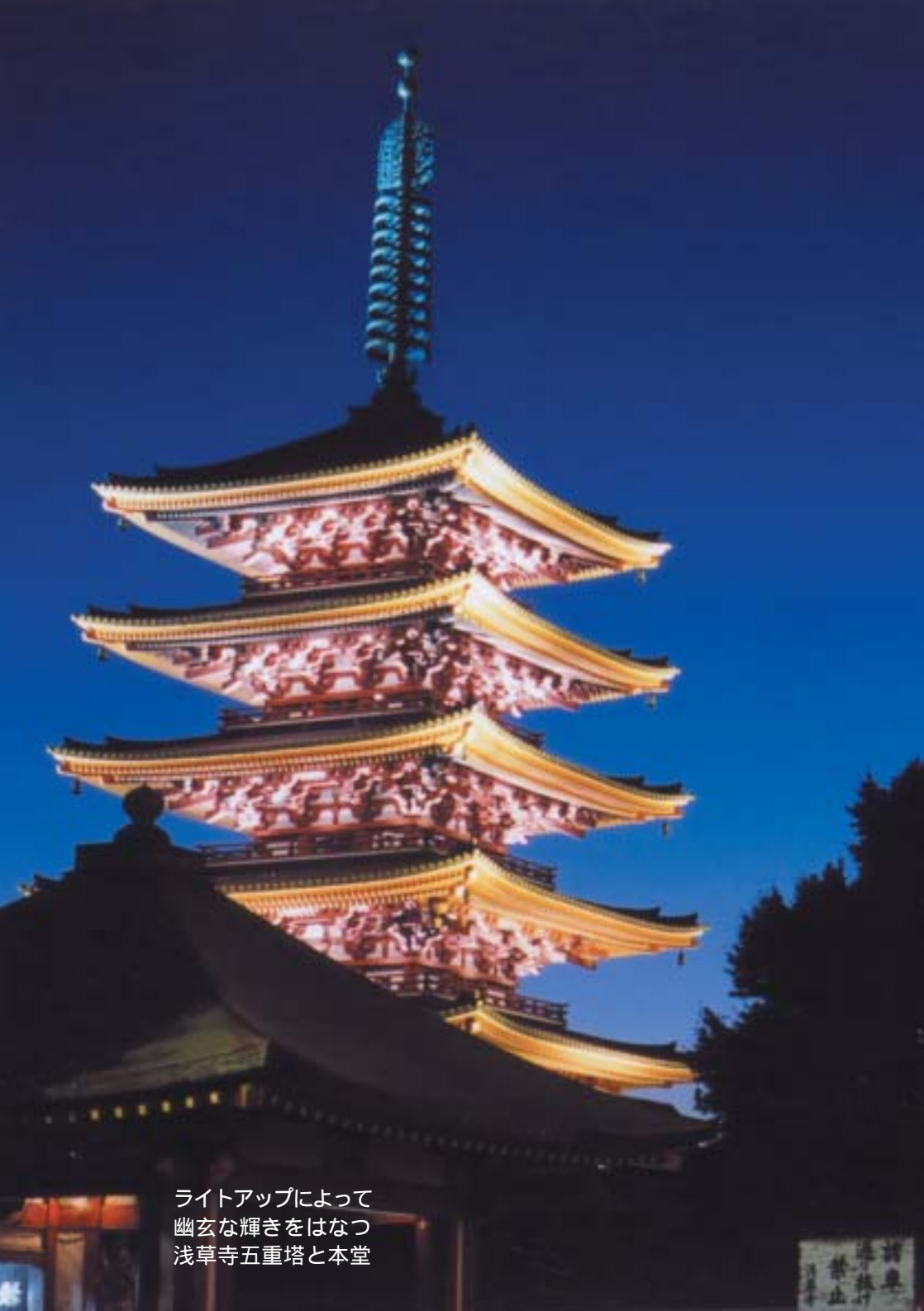
ライトアップによって 幽玄な輝きをはなつ 浅草寺五重塔と本堂